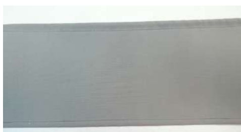
Faldilla recta con dobladillo.