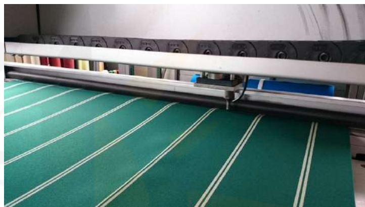
Corte de lona mediante máquina de ultrasonidos