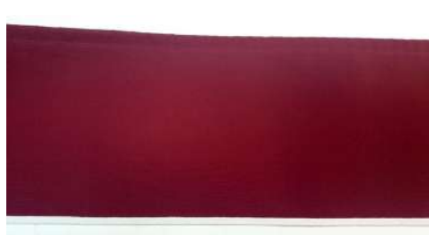
Faldilla recta con ribete.