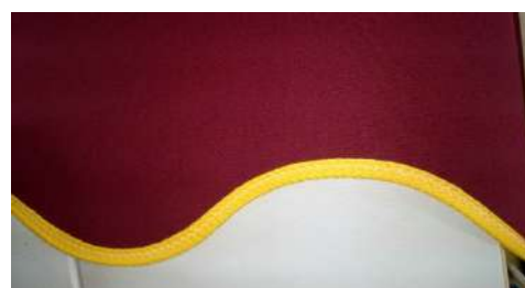
Faldilla con onda y ribete.