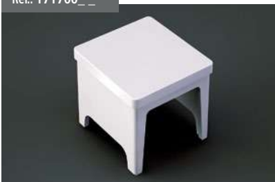
Tapón Adaptador 90x96 Adapter cap 90 x 96 Cache Adaptateur 90x96 Stopfen Adapter 90x96