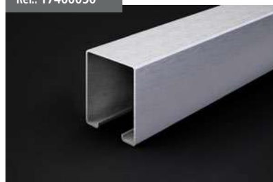
Empalme Guía y perfil 90x96 Guide connection and profile 90 x 96 Raccord Rail de guidage et profilé 90x96 Führungsanschluss und Profil 90x96