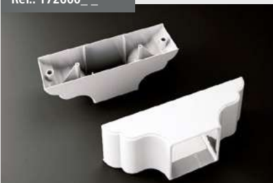
Soporte Capitel Pecho Paloma 90x96 Double corbel terminal support 90 x 96 Support Chapiteau Finition arrondie 90x96 Halterung Kapitell Zierleiste 90x96