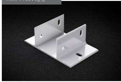
Soporte Guía 96x70 Guide Support 96x70 Support Rail de guidage 96x70 Führungshalterung 96x70