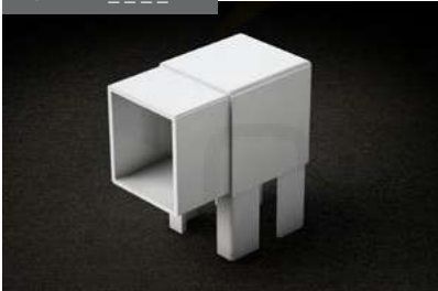
Soporte L 90x96 L supports 90 x 96 L supports 90 X 96 L-Halterung 90x96