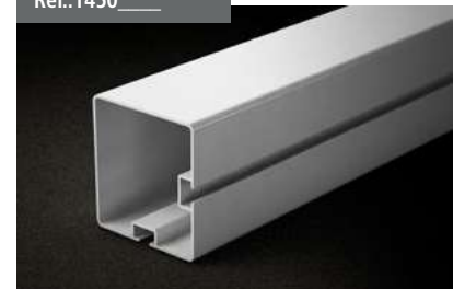
Perfil 90x96 2 ranuras 90 x 96 profile 2 slots 90 x 96 profil 2 équerres Stange 90x96 2 schlitzen