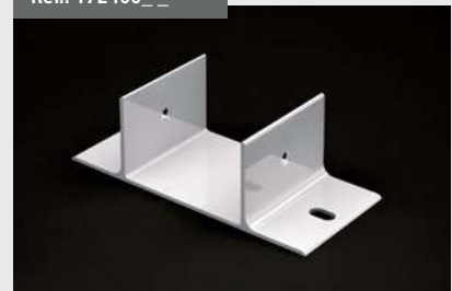
Soporte Pérgola 90x96 Pergola support 90 x 96 Support Pergola 90x96 Halterung Pergola 90x96