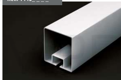
Guía 90x96 Guide 90 x 96 Rail de guidage 90x96 Führung 90x96