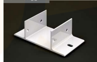
Soporte Guía 90x96 Guide Support 90 x 96 Support Rail de guidage 90x96 Führungshalterung 90x96