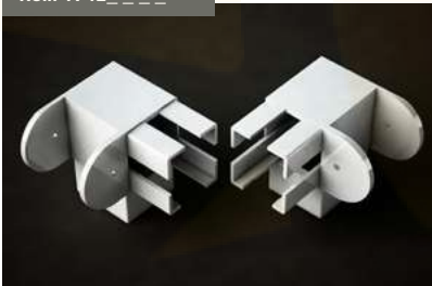
Juego Angular Articulado 90x96 Angular articulated set 90 x96 Jeu d'angle articulé 90x96 Gelenkwinkel-set 90x96