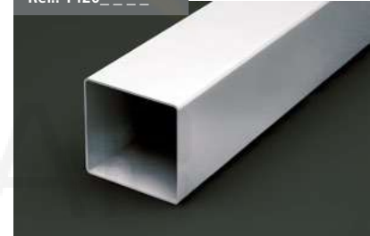
Perfil 90x96 Profile 90 x 96 Profilé 90x96 Profil 90x96