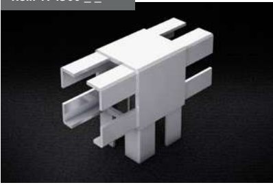
Soporte T 90x96 T supports 90 x 96 T supports 90 X 96 T-Halterung 90x96