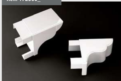
Terminal Pecho Paloma 90x96 Corbel Terminal 90 x 96 Griffe Finition arrondie 90x96 Terminal Zierleiste 90x96