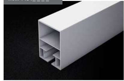
Guía 96x70 Guide 96x70 Rail de guidage 96x70 Führung 96x70