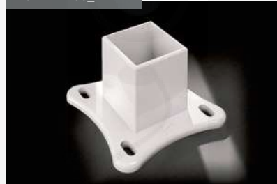
Pie 90x96 Ground support 90 x 96 Pied 90x96 Sockel 90x96