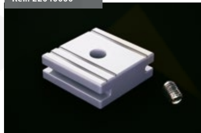
Tope Cortavientos Cut Wind Deadline Butoir Coupe-vent Windschutzanschlag