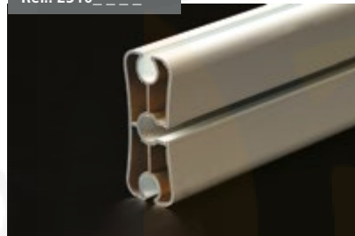
Perfil Carga Cortavientos Cut Wind Load Profile Profil Charge Coupe-vent Windschutzladeprofil