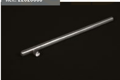
Pestillo Cortavientos Inox Inox Cut Wind Lock Verrou Coupe-vent Inox rostfr. Windschutzriegel