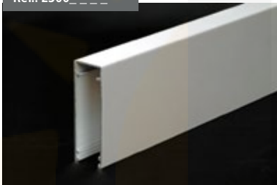
Perfil Guía Cortavientos Cut Wind Guide Profile Profil Glissière Coupe-vent Profil Windschutzführung