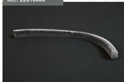
Cinta Guardapolvo Dust Cover Ribbon Bande Cache-poussière Überzug