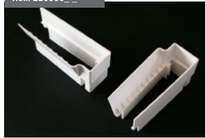
Juego Embudos Guía Cortavientos Cut Wind Funnels Kit Jeu Embouts Glissière Coupe-vent Set Trichter Windschutzführung