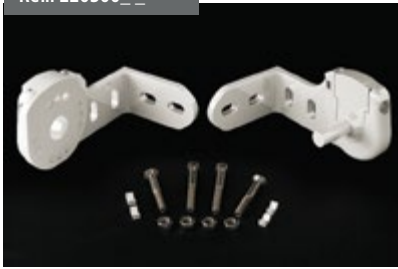
Juego Soportes Almagro Almagro Support Kit Jeu de Supports Almagro Set Almagrohalterungen