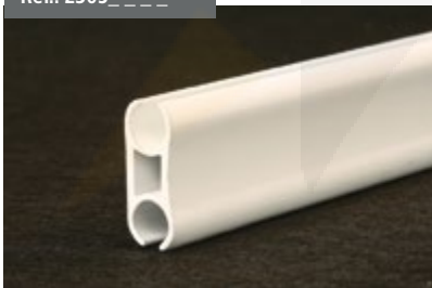
Perfil Intermedio Cortavientos Cut Wind Intermediate Profile Profil Intermédiaire Coupe-vent Windschutzzwischenprofil