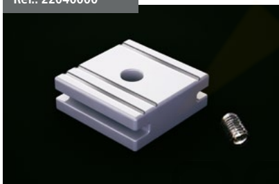
Tope Cortavientos Windbreak bufferstop Butoir Coupe-vent Windschutzanschlag