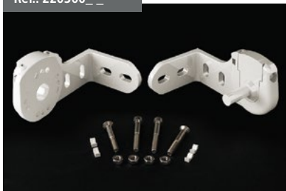
Juego Soportes Almagro Almagro support kit Jeu de Supports Almagro Set Almagrohalterungen