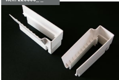
Juego Embudos Guía Cortavientos Windbreak funnel guide kit Jeu Embouts Rail de guidage Coupe-vent Set Trichter Windschutzführung