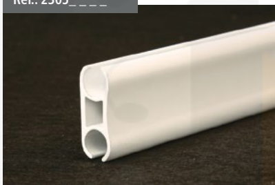
Perfil Intermedio Cortavientos Windbreak intermediate profile Profilé Intermédiaire Coupe-vent Windschutzzwischenprofil