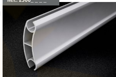
Perfil Intermedio Cortavientos PLUS Windbreak intermediate profile Profilé Intermédiaire Coupe-vent Windschutzzwischenprofil