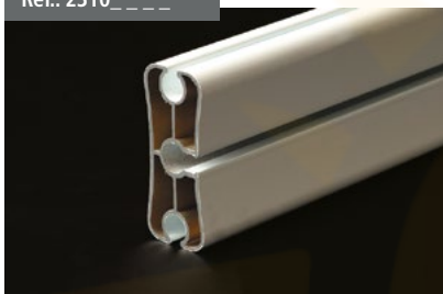
Perfil Carga Cortavientos Windbreak load profile Barre de Charge Coupe-vent Windschutzladeprofil