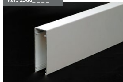
Perfil Guía Cortavientos Windbreak guide profile Profilé Rail de guidage Coupe-vent Profil Windschutzführung