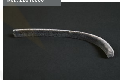
Cinta Guardapolvo Dust cover strip Bande Pare-poussière Überzug