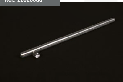
Pestillo Cortavientos Inox Stainless steel Windbreak clip Loquet Coupe-vent Inox rostfr. Windschutzriegel